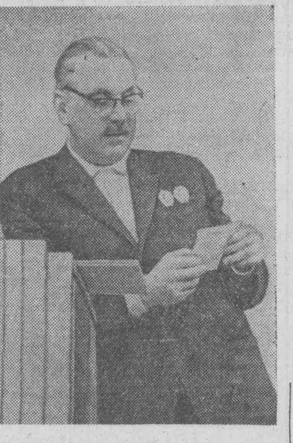
На снимке: Сергей Михалков в клубе куйбышевских журналистов.