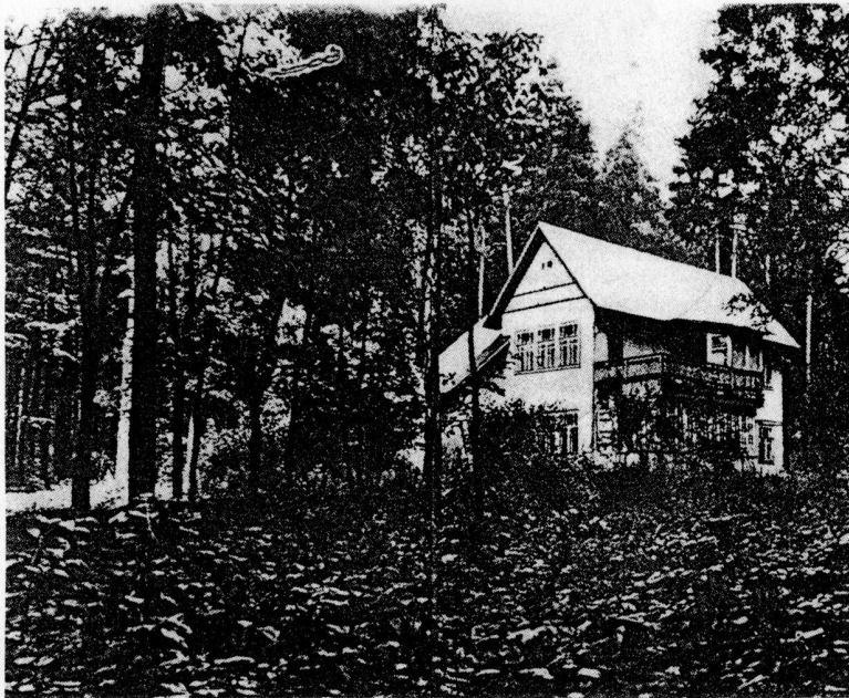
Дача Чуковских в Переделкине.

Опоры кое-как подправить удалось Гуманитариям-студентам. И дыры залепить; до утра улеглось Корыто старое с цементом.