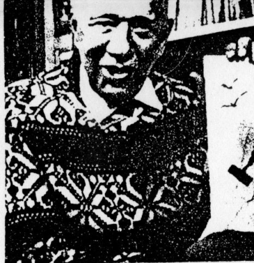
К.И. Чуковский в своем кабинете.

— Я-то требую, чтобы они взяли под ответственность, а они не хотят.