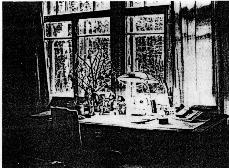
Так выглядел один из уголков музея в 1980 году.

Но Лидия Корнеевна считалась и считается гражданкой второго сорта. Чуковским ответили: железа нет