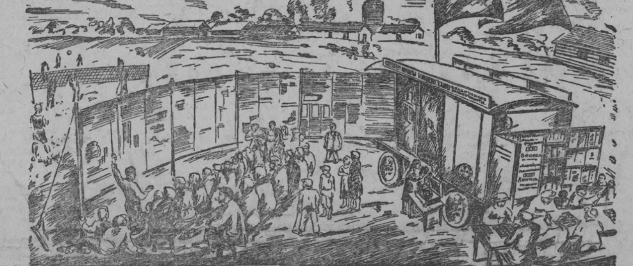
РИСУНОК УЧАСТНИКА АГИТПОЕЗКИ т. ЗАХАРЬЯНА

«Итак же бесконечное число благодарностей от колхозников, из которых многие, по их признанию, впервые видели и столько вознизи, и столько внимания к себе...»