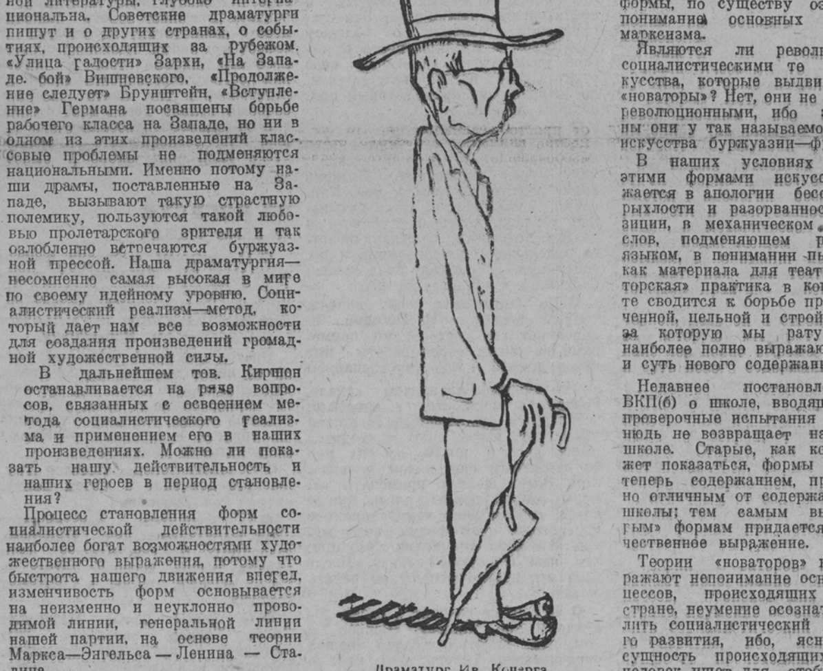
Драматург Ив. Кочерга

Н. Погодин говорит о том, что драматург-социализм является наиболее прогрессивным. Он считает, что драматург-социализм является наиболее прогрессивным. Он считает, что драматург-социализм является наиболее прогрессивным. Н. Погодин считает, что драматург-социализм является наиболее прогрессивным. Он считает, что драматург-социализм является наиболее прогрессивным. Он считает, что драматург-социализм является наиболее прогрессивным.