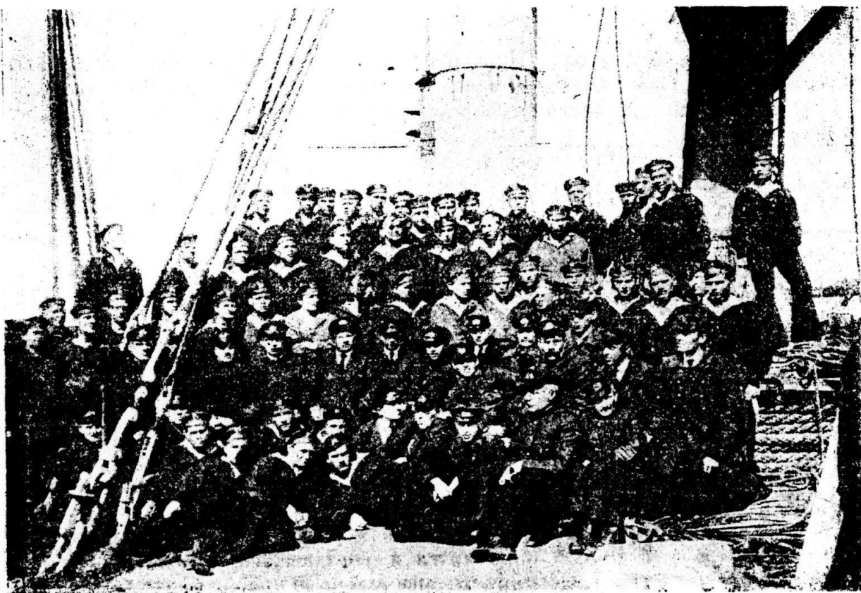
Командир и боевые старшины одного из крейсеров.

Выходим из клещей фортов. Впереди открытое море дымится вечерней мглой.