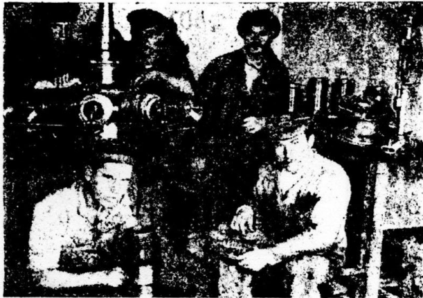
За переборкой моторов

— Осталась тут после белых лодка с дыркой, да челнок без дна... И наш корабушка по уши в воде торчал. Котлы порваны, арматура снята: ржавчины на вершок, травой все поросло, глядеть—сердце воротит. Приказ, „Восстановить“—Есть.—Какой разговор? Есть и отдирай пока не примерзло. Взались. Давай, давай. С чего взяться? Струменту нет. Материалу нет. Денег нет. Хлеба мамалыжного полфунта на нос.. В трюмах вода, в рулевом отделении вода, в кочегарке вода. Клапаны порваны, отсеки разведены—ну, разруха во всероссийском масштабе... Качать воду то надо, а как ее будешь