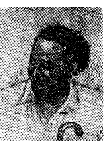
Если двадцать лет тому назад это было, хотя и научно обоснованной, но все же лишь теорией, то теперь эта теория доказана на деле первой социалистической страной — Советским Союзом.

В Советском союзе не может быть и речи об «интеллектуальной перепроизводке», о которой говорят в капиталистических странах. Напротив, грандиозный подъем хозяйственной и культурной жизни 180-миллионного народа создает такие громадные возможности для применения научных, технических и артистических высококвалифицированных сил, что высшие школы, в деле подготовки этих сил, почти не в состоянии поспеть за общим развитием. И это несмотря на то, что число высших школ и число студентов непрерывно увеличивается. Наука не только не ставится никакие рогатки, но и смелые исследования во всех областях встречаются широчайшую поддержку. Студент, кончающий в Советском союзе высшую школу, может быть уверен, что он получит не одно, но множество предложений работы, на которой он сможет немедленно применить свои познания и свое искусство на пользу обществу. Задача, которую ему предстоит разрешить, возможности, которые перед ним открываются, настолько грандиозны, что оставляют далеко позади самые смелые мечты утопических поэтов и мыслителей XIX столетия. Превращение классов в капиталистических странах знают, какую притягательную силу оказывает этот пример Советского союза на студенческие массы всего мира. Поэтому они стараются во всех странах при помощи