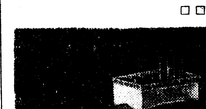
В ИВАНОВЕ строится театр на 2500 зрителей по проекту архитектора ВЛАСОВА. На снимке: проект строящегося театра.

предприятий, в школах и литературных кружках города.