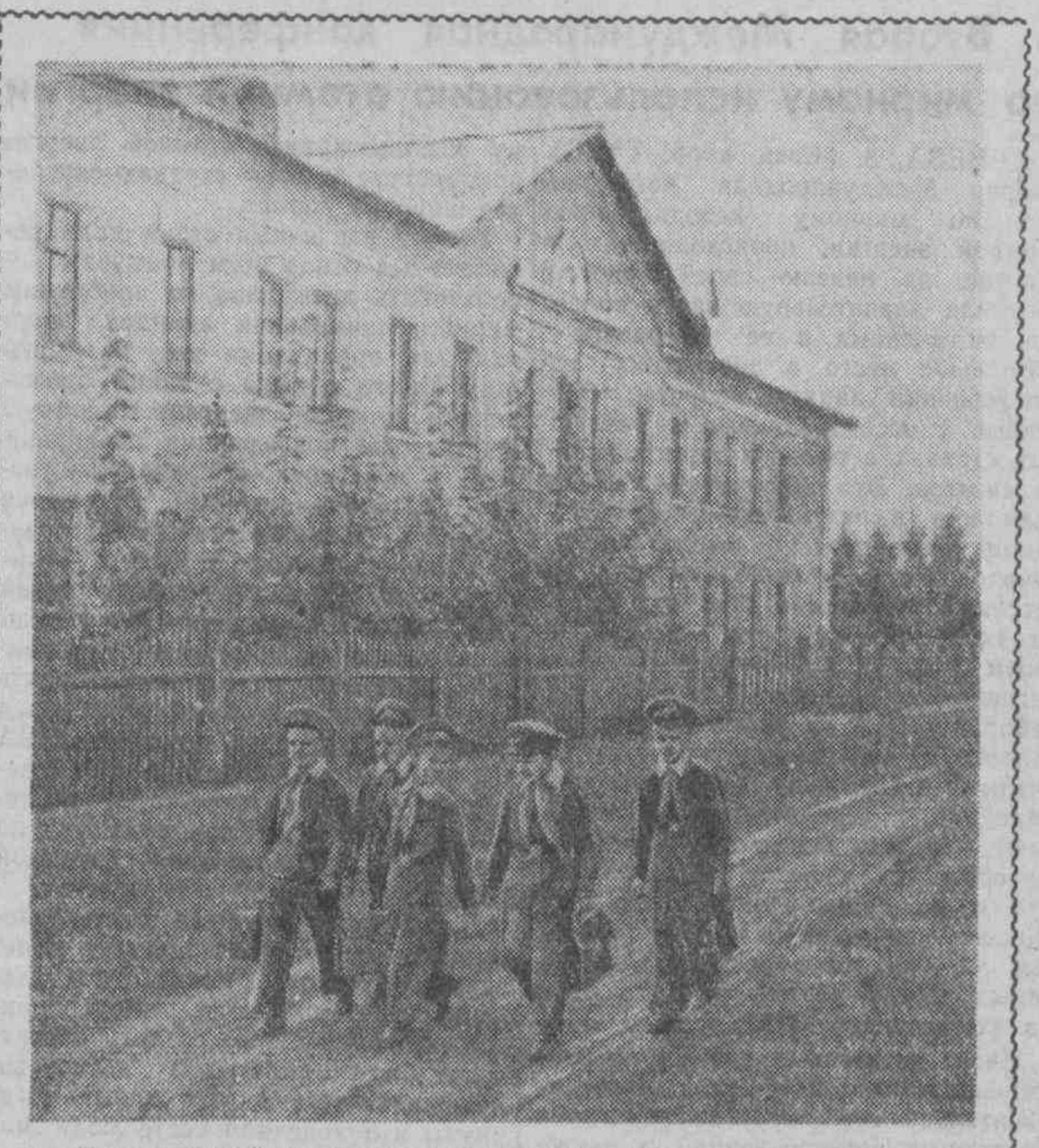
Пошел третий год с момента открытия школы-интерната № 1 на станции Кротова Куйбышевской железной дороги. Сейчас здесь живет и учится 150 детей. На снимке: ученики 4-го класса идут утлом в школу.

И. ВОРОНИНА. Спец. корр. «Волжской коммуны».