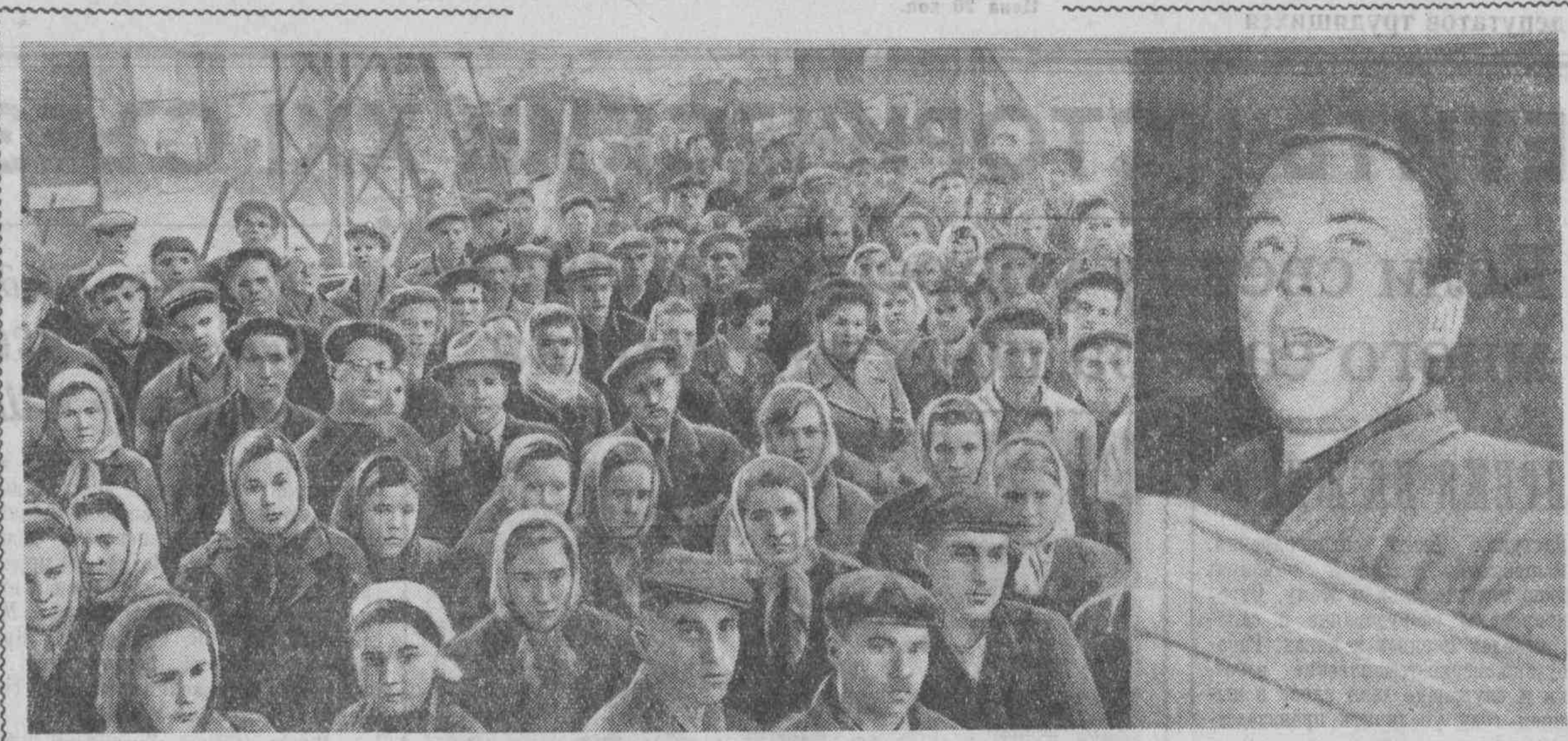
Митинг строителей и монтажников цеха «Металлургстрой», посвященный постановлению сентябрьского Пленума ЦК КПСС о созыве внеочередного XXI съезда партии. Выступают цеховые работники цехов цехового цеха.

Участники собрания единогласно приняли социалистические обязательства завода в честь XXI съезда партии.