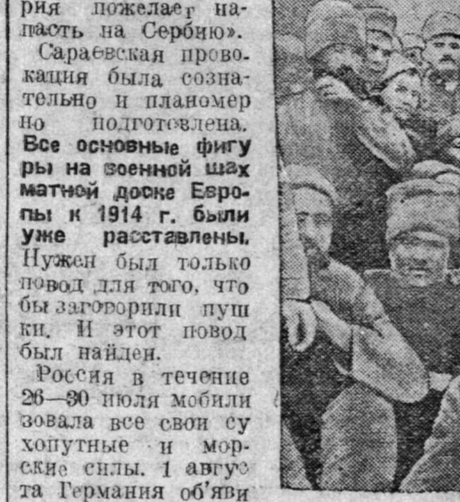
После трехлетней бойни пролетарии решили положить конец бессмысленной империалистической войне...