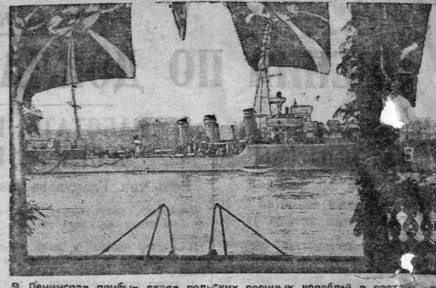
В Ленинград прибыл отряд польских военных кораблей в составе двух иждивенных эскадренных миноносцев «Бура» и «Вихрь». Отряд прибыл под флагом командующего контр-адмирала Урург. НА ШИММЕР: Польский миноносец «Бура» на реке Неве в Ленинграде.

Культурная работа требует и финансовых средств. Мы обязуемся вовремя и бережливую работу и выигрывать работу обраться, сделать ее достойно культурным учреждением.