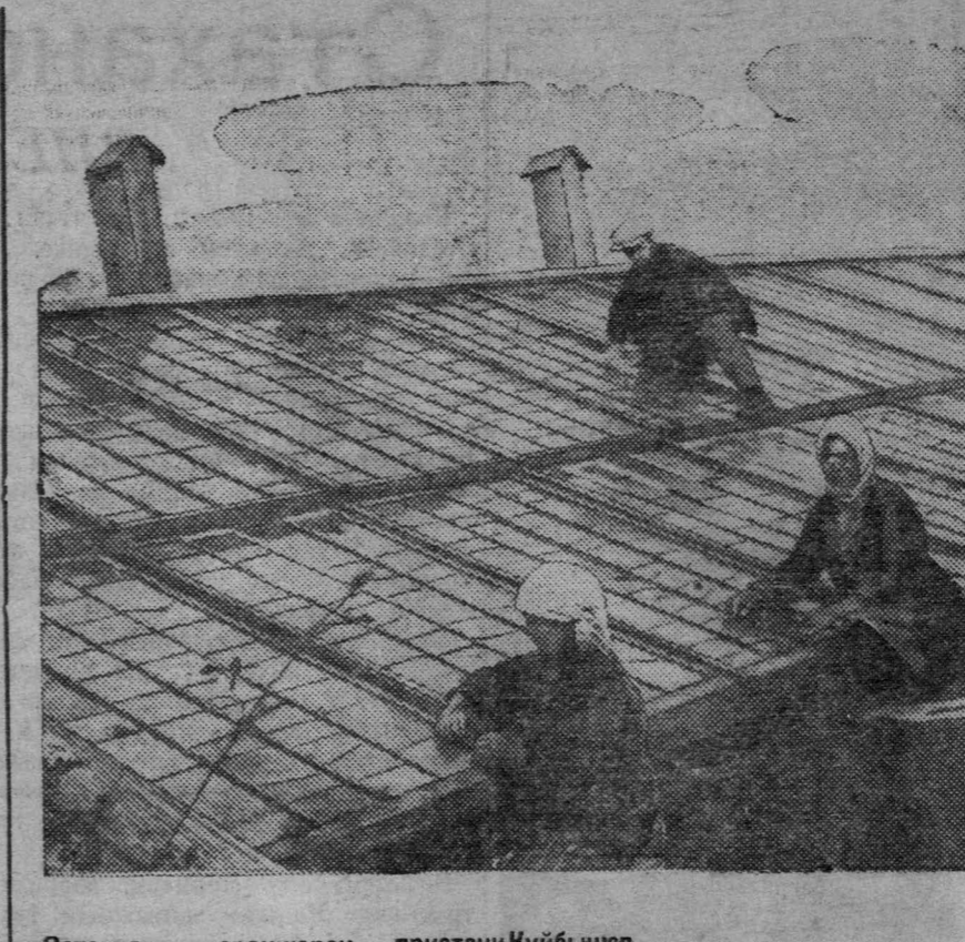
Остекление оранжереи пристани Куйбышев.

В Октябрьские дни состоится открытие нескольких детских лечебных учреждений. Три детских амбулатории при второй, третьей и четвертой поликлиниках открываются в Куйбышеве. Закачивается ремонт Куйбышевского детского оздоровительного санатория (первая передела). Новый филиал терапевтического кабинета при детской поликлинике открывается в Пензе. Уже монтируется новое оборудование и аппаратура (КрайТАСС).