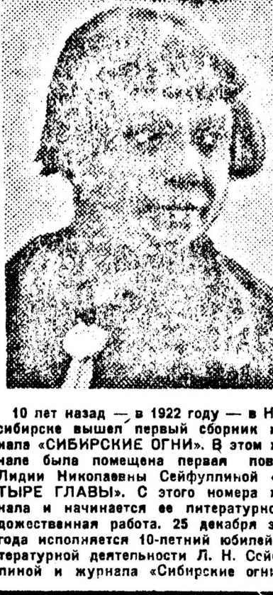
10 лет назад — в 1922 году — в Новосибирске вышел первый сборник журнале «СИБИРСКИЕ ОГНИ».

Не забываясь литературной славы, люди этой профессии в нашей стране притесняются не земле, к воде и в воздухе естественных возможностей, что сердце начинает биться торопливо и радостно.