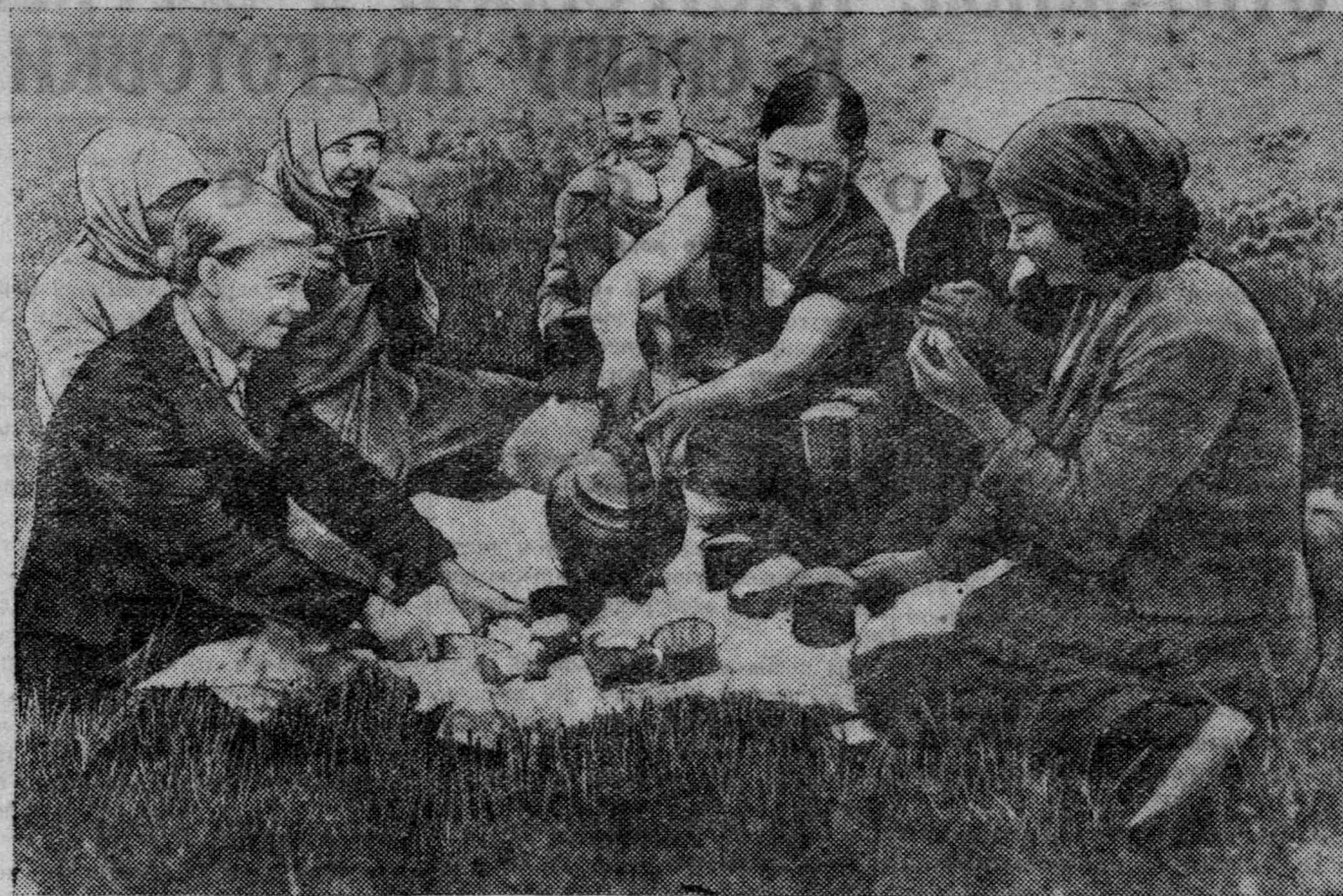
На полях стане третьей бригады колхоза имени Цветкова, Тагайского района. Завтрак польщиков.