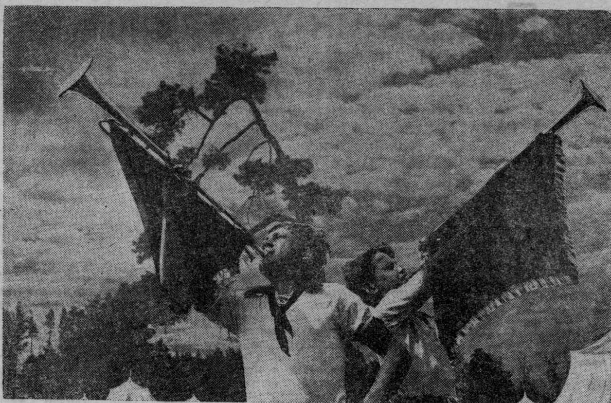
Утренний подъем в писемском лагере.