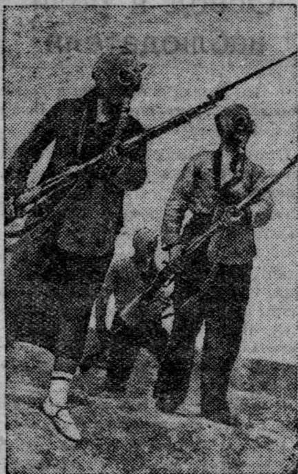
Военно-тактические занятия студентов 2 курса Плано-экономического института. На снимке: атака в противогазах.