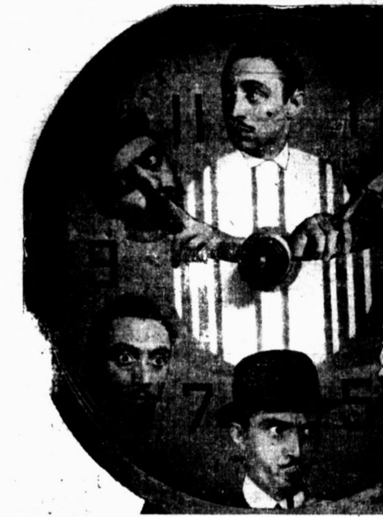
За последнее время в Голливуде очень выдвинулся русский артист Миша Ауэр, которому дают в фильмах ответственные роли. На снимке Миша Ауэр показан в некоторых ролях, в которых он сыграл интересные типы в фильмах «Три лодки в городе», «На вершине города» и др.

экрана или нет. Есть ли в ней благодарный материал, и подходит ли она для кино-аппарата и микрофона. Если есть, я посылал его немедленно на пробную сцену. Если это случится в Нью-Йорке или где-нибудь в восточных штатах, я отправляю ее в кино-студию под Нью-Йорком. Там делают пробную съемку: крутят несколько сцен, монодуют и т. п. Фильму я затем посылал в Голливуд.